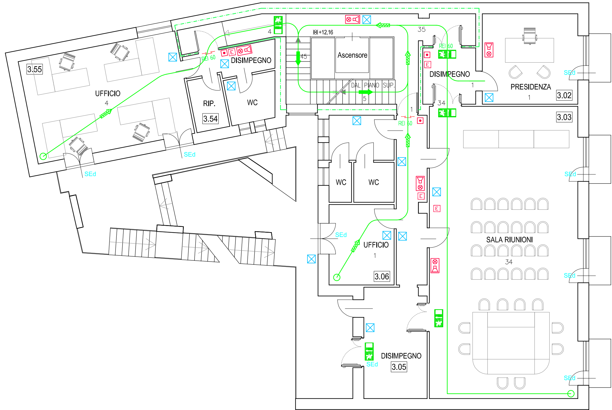
Piano Terzo q.ta +9,00 misure in m scala 1:100